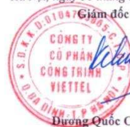
Dương Quốc Chính