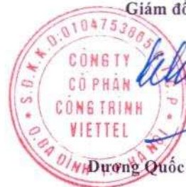
Dương Quốc Chính