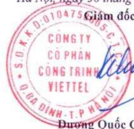
Dương Quốc Chính