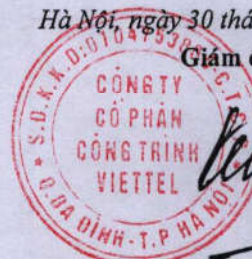
Dương Quốc Chính