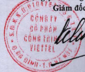
Dương Quốc Chính